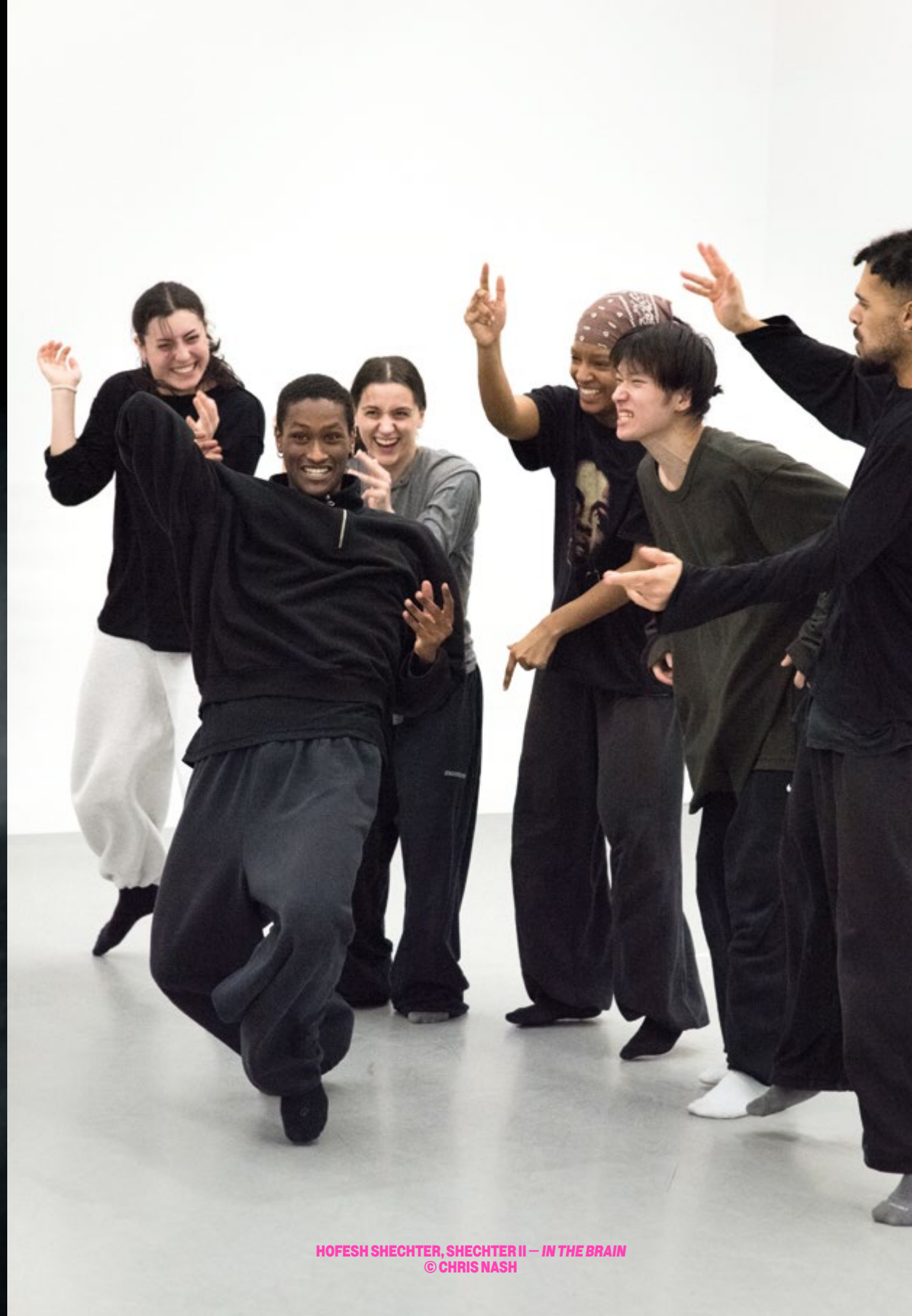
HOFESH SHECHTER, SHECHTER II – IN THE BRAIN