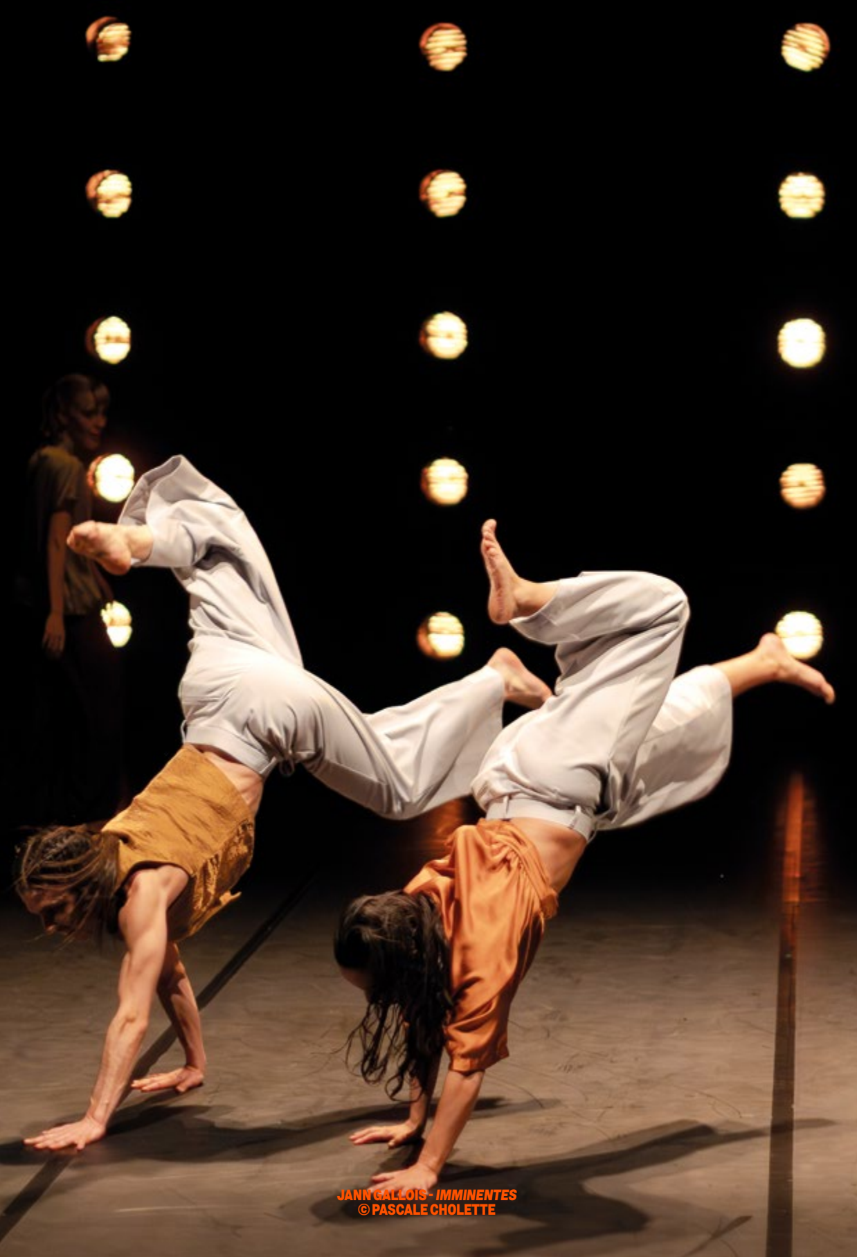
JANN GALLOIS - IMMINENTES © PASCALE CHOLETTE