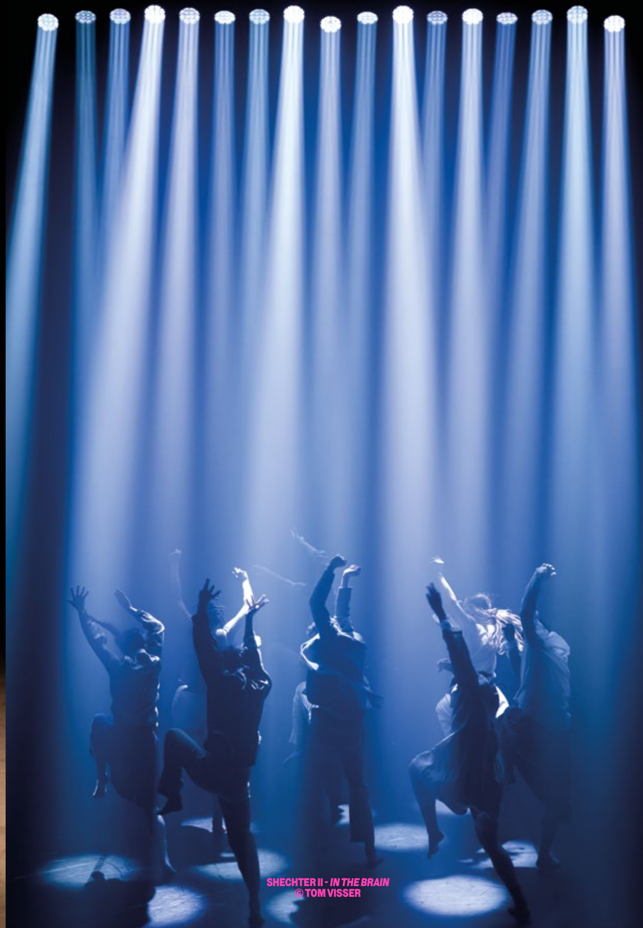
SHECHTER II - IN THE BRAIN